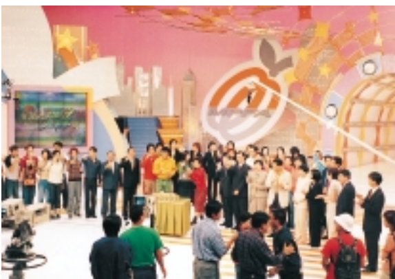
電視綜合性節目宣傳強積金。

全港多處地方亦掛起大型廣告牌，以「得益始終係自己」為題，帶出計劃成員退休時可享的成果。積金局亦有印製以這個標語為題的地鐵海報。