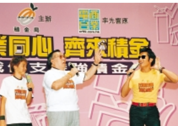
電台節目主持人協助推廣強積金。