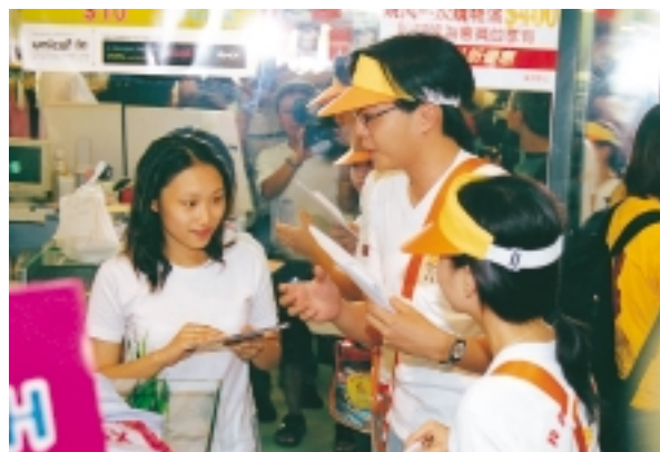
在洗舖大行動中，積金大使走訪逾50 000家商舖。