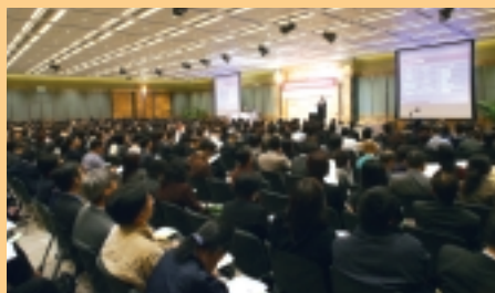
投資教育是積金局重點工作之一。

積金局繼續推行公眾教育，內容圍繞強積金投資知識以及個人的強積金權責。年內，積金局與電台聯合製作逾30輯節目，在不同時段播放，以廣播劇或問答形式講解強積金投資知識及其他強積金課題，甚受聽眾歡迎。積金局同時向六份主要報章供稿75篇，講述強積金投資課題，並把部分供稿結集成《積金投資攻略》小冊子，向公眾派發。