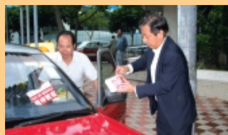
與工會合辦活動，加強自僱人士對強積金的認識。