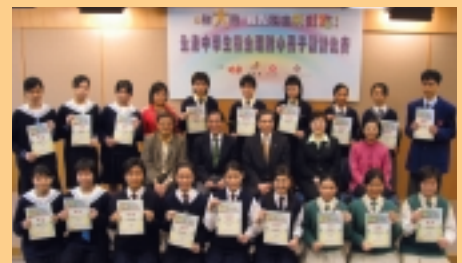
「全港中學生積金理財小冊子」設計比賽得獎隊伍。