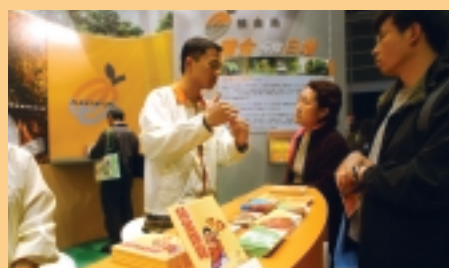
向參觀2004教育及職業博覽的人士講解強積金制度。