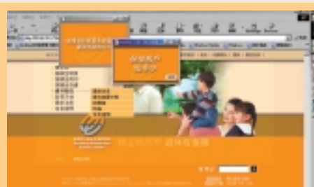
透過本局網頁推廣「加強資料發放計劃」及其他強積金項目。