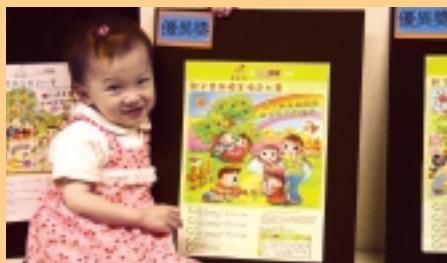
「親子齊來積金填色比賽」中最年幼的得獎者。

積金局積極向青少年灌輸為將來儲蓄的觀念。為此，年內舉辦的青少年教育活動以即將投身社會的年青人為主，亦包括學生及兒童。積金局希望藉着有關活動，讓年青人在就業之前便認識強積金制度，以及讓學生及兒童從小認識理財對退休生活的重要性。