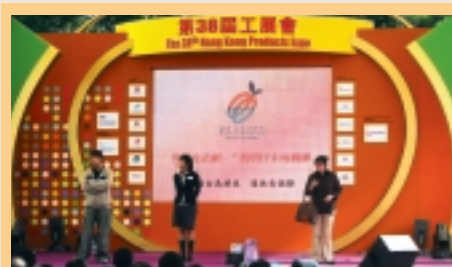
在第三十八屆工展會上表演話劇，鼓勵僱員盡早籌劃退休後的生活。