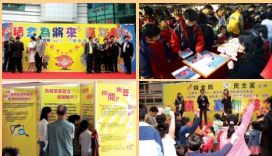
與社區人士齊心推廣強積金。

2004年2月至5月期間，積金局與民建聯及民主黨合辦18場積金嘉年華，其中八場已於2004年3月底前舉行。嘉年華的活動包括攤位遊戲、資訊展覽、資料查詢站以及表演等。市民反應熱烈，入場人數眾多，攤位遊戲以及即場派發的刊物大受歡迎。