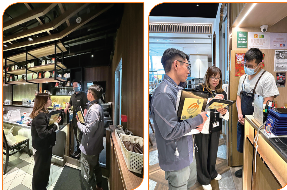
定期巡查以確定僱主有否遵守強積金法例